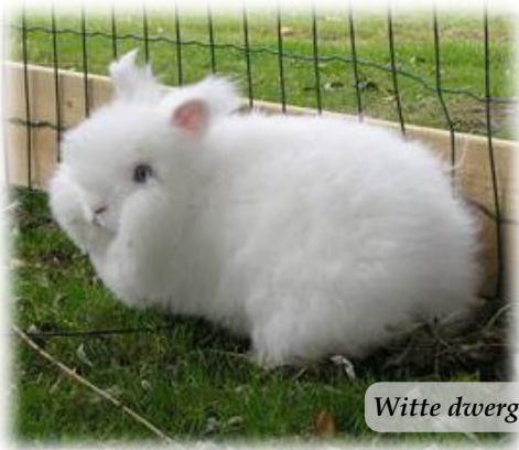
Witte dwerg angora