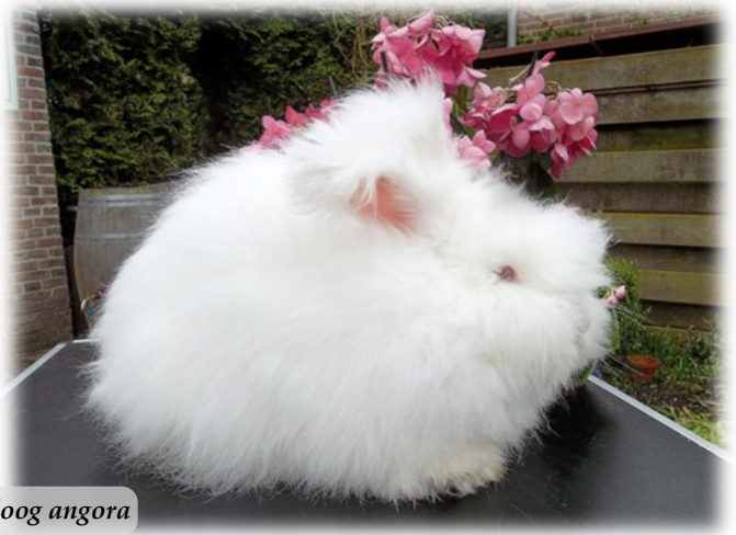
Witte roodoog angora