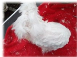
en na het knippen