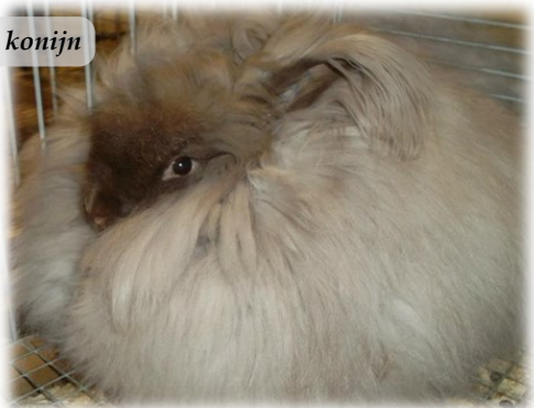
Bruin angora konijn