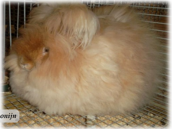
Geel angora konijn