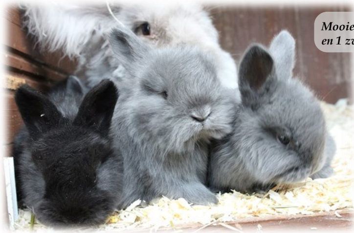
Mooie blauwe jongen en 1 zwartje.