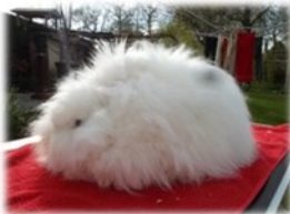
Voor het knippen

Het knippen gebeurt het makkelijkst met een goede scherpe schaar. In het begin zal een knipsessie lang duren. Het is zelfs aan te raden om het in twee keer te doen. Zet een schaar nooit zomaar in de vacht, maar kijk of voel voordat je knipt. Bij voedsters let je op de tepeltjes, bij de rammen op hun testikels. Als de knipbeurt erop zit, ziet het konijn er gek uit! Je kunt een konijn nooit mooi in model knippen waardoor er soms gekke creaties ontstaan, maar na twee weken zie je hier al bijna niks meer van. Ieder ras heeft zo zijn gebruiksaanwijzing wat betreft het knippen. kijk voor meer informatie hierover het hoofdstuk "De Rassen".