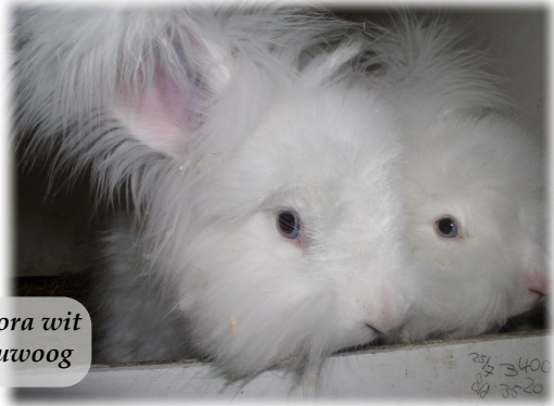
Angora wit blauwoog