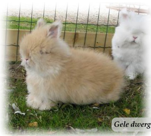
Gele dwerg angora